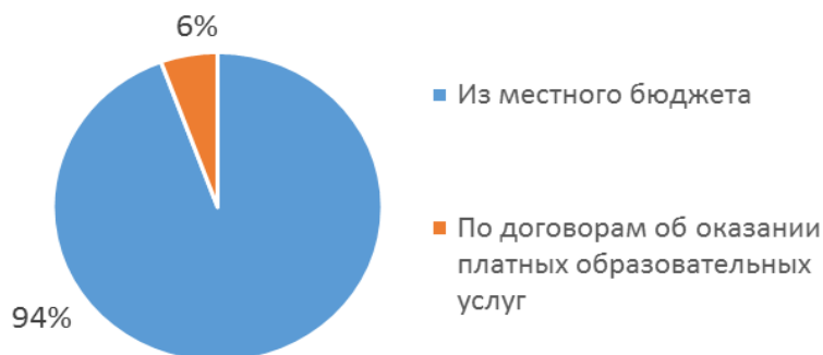
Распределение численности учащихся по источникам финансирования

Организация образовательной деятельности в МБУ ДО «Центр дополнительного образования» осуществляется в соответствии с Образовательной программой, календарным учебным графиком, учебным планом. Образовательная деятельность соответствует основным принципам государственной политики РФ в области образования.