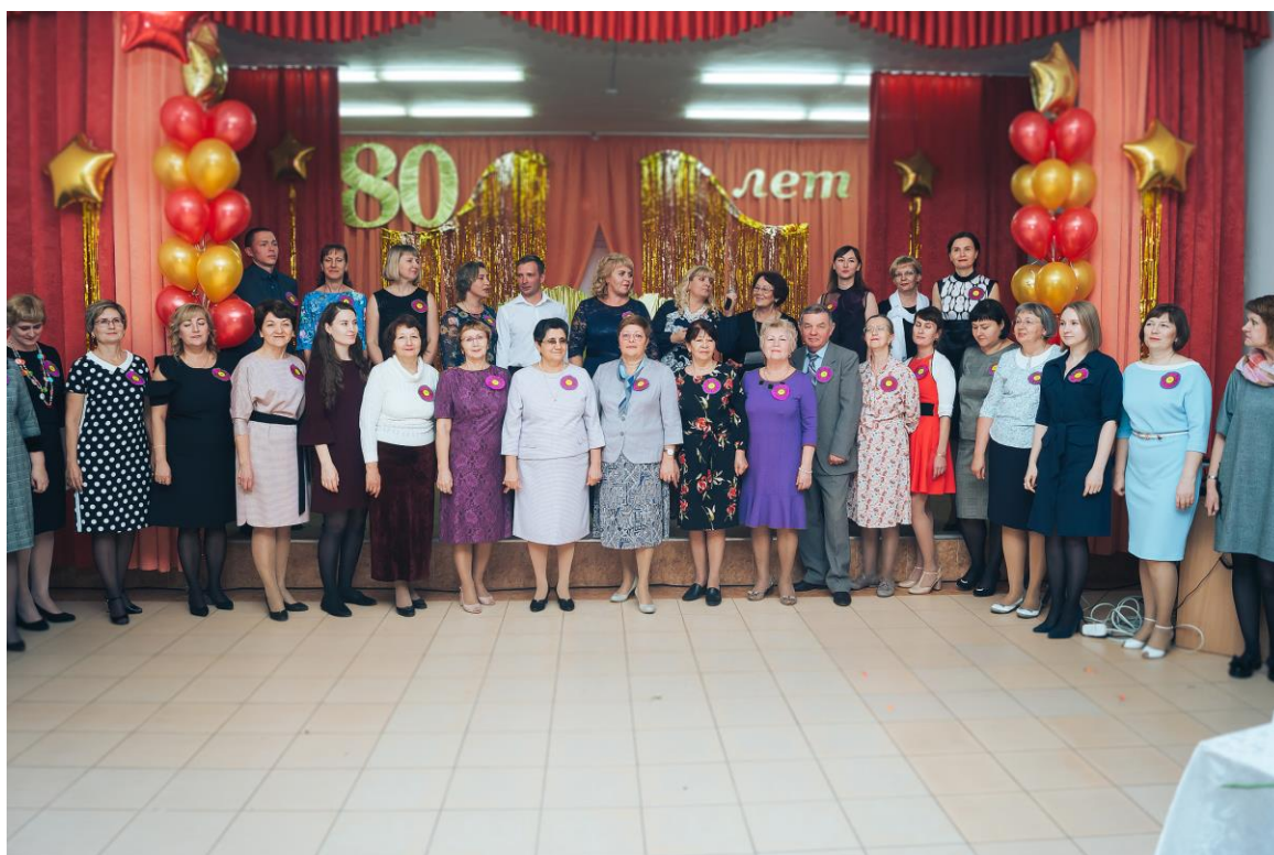
Развитие кадрового (педагогического) состава образовательного учреждения

На сегодняшний день в Лицее № 10 работает 44 педагога, включая администрацию учреждения. Штат укомплектован на 100%. Педагогический коллектив стабилен, 72% коллектива работает в школе 20 и более лет. Средний возраст педагогического коллектива - 45 лет, 18% учителей 55+. В 2020/2021 году в школу пришли работать 3 педагога в возрасте до 25 лет. Профессиональный рост и аттестация педагогических кадров - один из наиболее важных факторов, влияющих на качество образования. С педагогами школы ведется целенаправленная работа по мотивации профессионального роста, повышения квалификации. В результате в течение последних двух лет курсы повышения квалификации закончили все учителя - 100%.