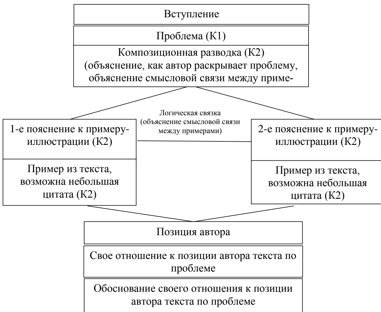
Рис. 1. Схема написания сочинения на ЕГЭ

Рассмотрим возможную схему написания сочинения.